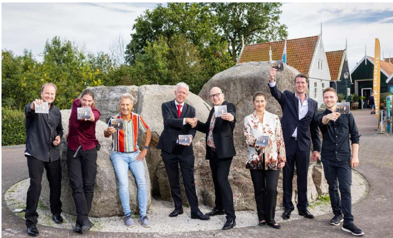
Op Schokland overhandigde Black Pencil zondag 03 september 2023 het eerste exemplaar van de cd aan Commissaris van de Koning Leen Verbeek.

De fysieke drager is te bestellen oa via onze webshop https://www.visionor-webshop.com/a-83007653/cd-and-dvd-releases/schokland-2023/