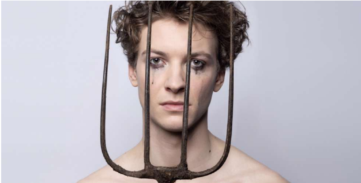
PR-beeld Black Pencil & Theatergroep Suburbia, zomer 2023

De zomerproductie Tom op de boerderij was gebaseerd op het zeer succesvolle toneelstuk Tom à la ferme (2011) van Michel Marc Bouchard: