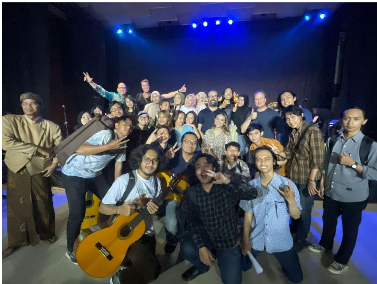
Presentatie workshop Black Pencil in Bandung, augustus 2023

Black Pencil wil fungeren als eye-opener. We willen prikkelend aanbod blijven genereren in klassieke en vooral hedendaagse klassieke muziek.