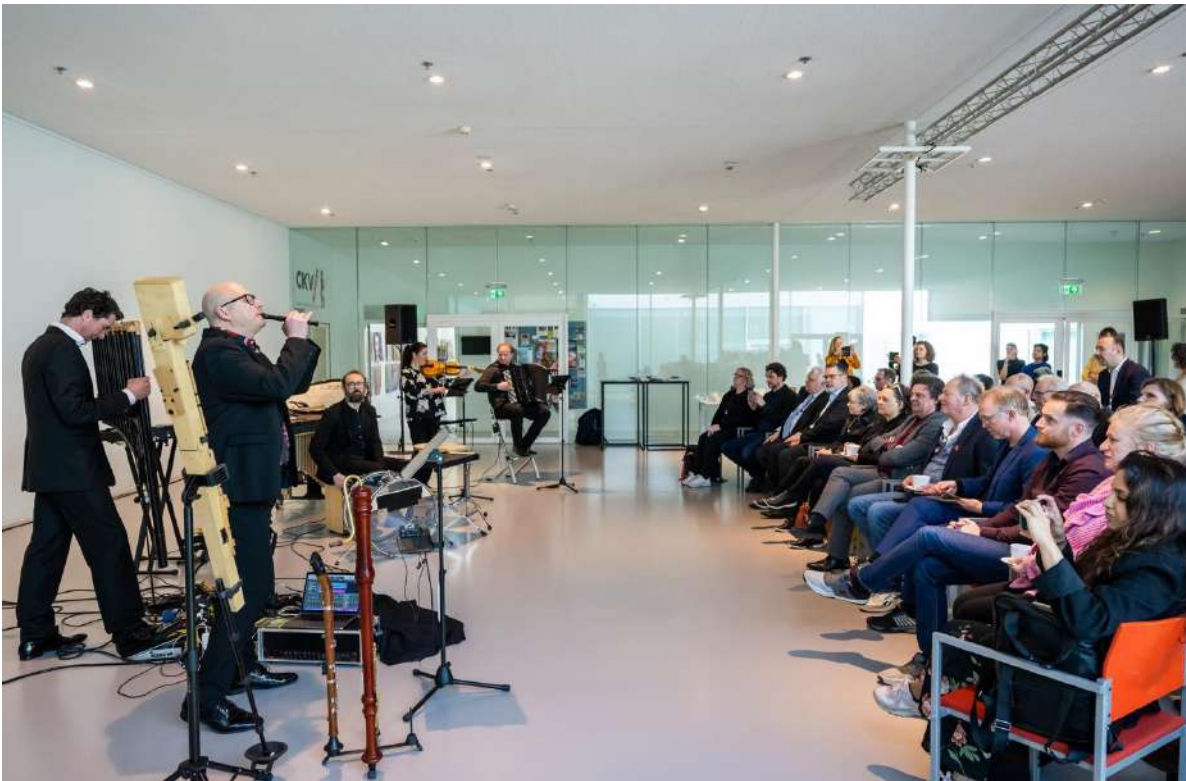
Black Pencil speelt voor de Raad voor Cultuur, Kunstlinie Almere, april 2023

De bezoldiging van de artistiek en zakelijk leider lag in 2023 ruim onder de wettelijk gestelde bezoldigingsmaxima volgens de Wet Normering Topinkomens .