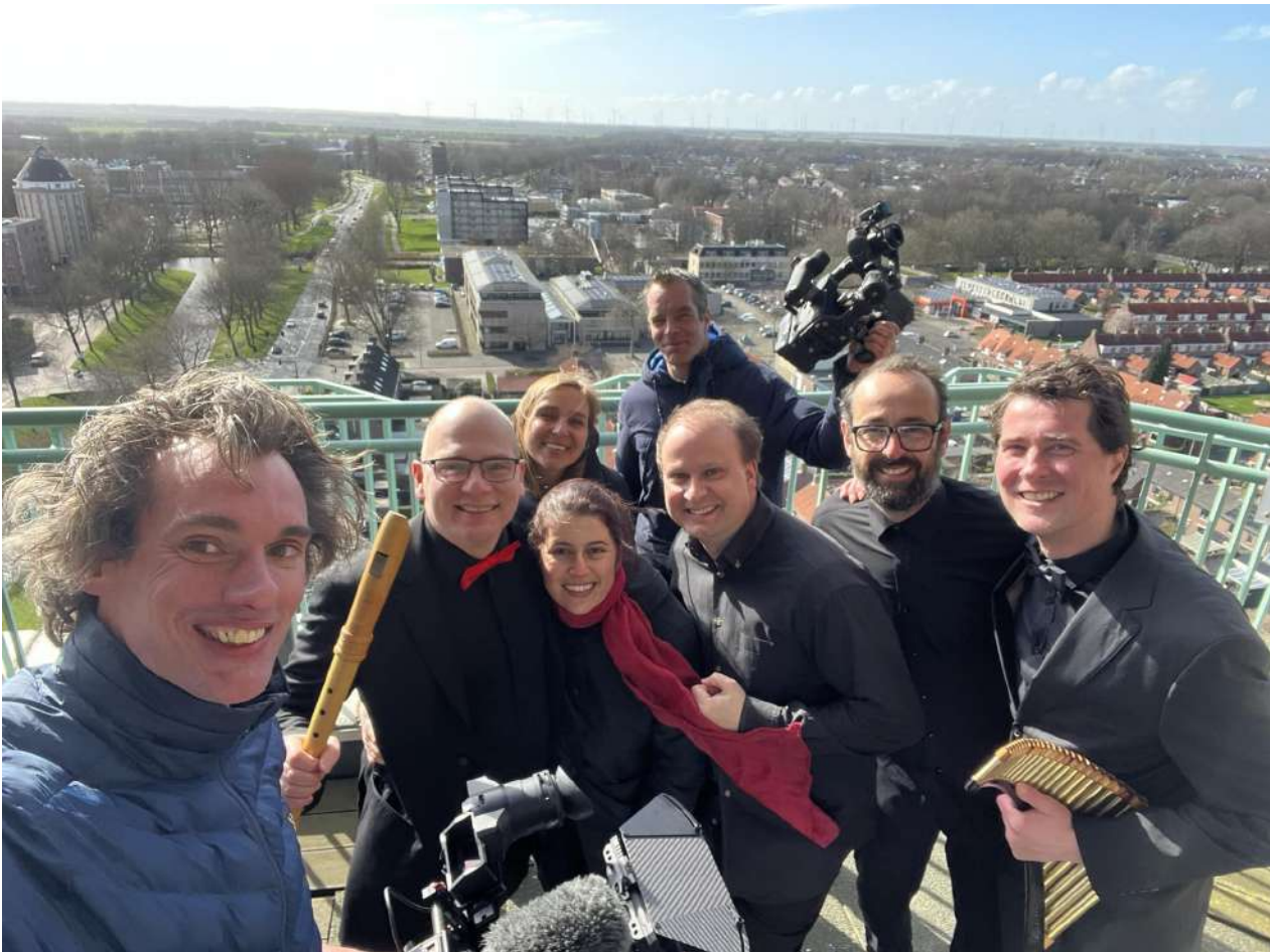
Na de video opnames van Monteverdi in de Poldertoren van Emmeloord

Iedereen was wederom enthousiast over de samenwerking. Deze zal in 2024 worden voortgezet.